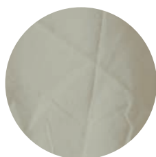
Gr105 Green brown 50% BRS Verde / BRS Rubi 50% (OCCRegenerative Brazil)