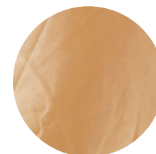
Br103 Red brown 15% BRS Rubi / 85% Branco Mocó (OCCRegenerative Brazil)