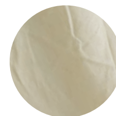
Gr104 Pastel green 2 15% BRS Verde / 85% Branco Mocó (OCCRegenerative Brazil)