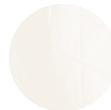
Ec001 Aegean ecru 1 100% Aegean (OCCRegenerative Turkey)