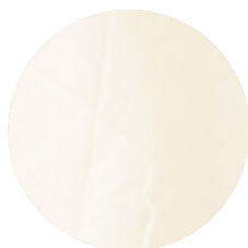
Ec002 Egyptian cream 100% Giza 95 (OCCBiodynamic Egypt)