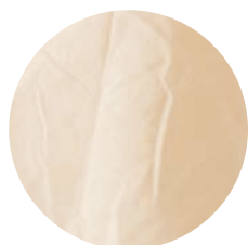
Br107 Pastel brown 1 50% BRS Rubi / 50% Branco Mocó (OCCRegenerative Brazil)