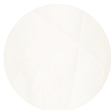
Wh001 Egyptian white 100% Giza 92 (OCCBiodynamic Egypt)