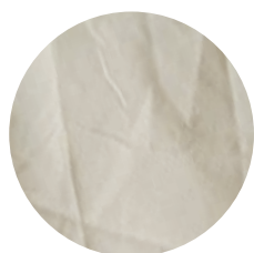
Gr108 Pastel green 1 50% BRS Verde / 50% Branco Mocó (OCCRegenerative Brazil)