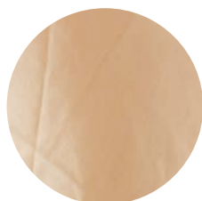
Br102 Pastel brown 2 30% BRS Rubi / 70% Branco Mocó (OCCRegenerative Brazil)